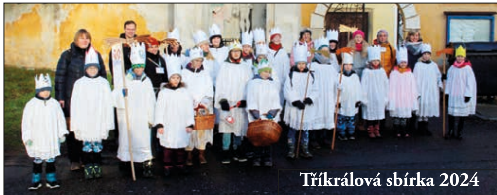
Tříkrálová sbírka 2024

VÁŽENÍ OBČANÉ, PŘEJEME VÁM, ABY VÁNOCE BYLY PLNÉ KLIDU, MÍRU A POHODY A NOVÝ ROK PŘINESL MNOHO RADOSTI, ZDRAVÍ A ÚSPĚCHŮ A DOBRU VZÁJEMNOU SPOLUPRÁCI PŘI ZVELEBOVÁNÍ NAŠÍ OBCE. KRÁSNÉ VÁNOCE A ŠTASTNÝ NOVÝ ROK PŘEJE KOLEKTIV OBCENÍHO ÚŘADU A ČLENOVÉ OBCENÍHO ZASTUPITELSTVA.