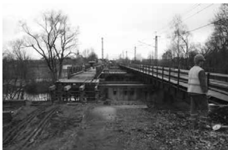
Výměna mostní konstrukce v roce 2008