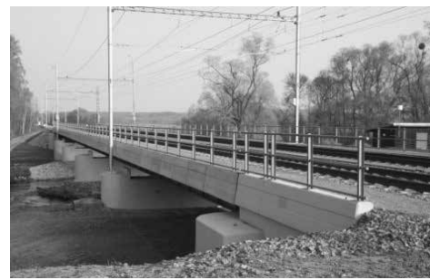
Stav mostu v roce 2009

běhla kompletní rekonstrukce nádraží v Moravičanech včetně železničního mostu přes Mo-