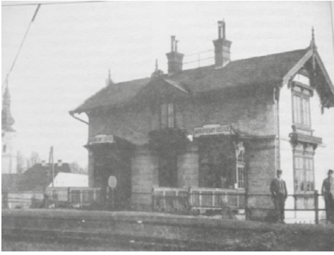
Nádraží Moravičany v roce 1925

si tehdy neznámé technické pokroky. Protože tyto lokomotivy mohly dosáhnout maximální rychlosti 40km/h, konvoj se pohyboval k Praze velmi pomalu. První lokomotiva Böhmen s Ing. J. Pernerem slavnostně vjela do Prahy 20. srpna 1845, kde propukly velké oslavy. V ten den vyjel první osobní vlak z Olomouce v 6 hodin a 20 minut. Parní lokomotiva táhla osm vagonů, v nichž seděl i rakouský arcivévoda František Karel se svoji družinou. Do Zábřeha tento vlak přijel okolo deváté hodiny dopolední, tudíž přes Moravičany projížděl zhruba okolo osmé hodiny. Tímto byla zahájena pravidelná vlaková doprava. Nutno však zmínit, že v této době ještě v Moravičanech nebyla zastávka, takže tudy vlaky jenom projížděly. Pro Ing. Jana Perneru se stalo osudo-