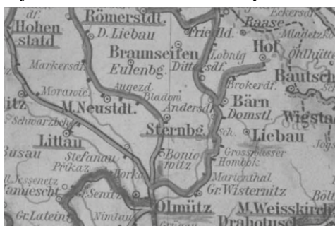
Železniční mapa z roku 1894