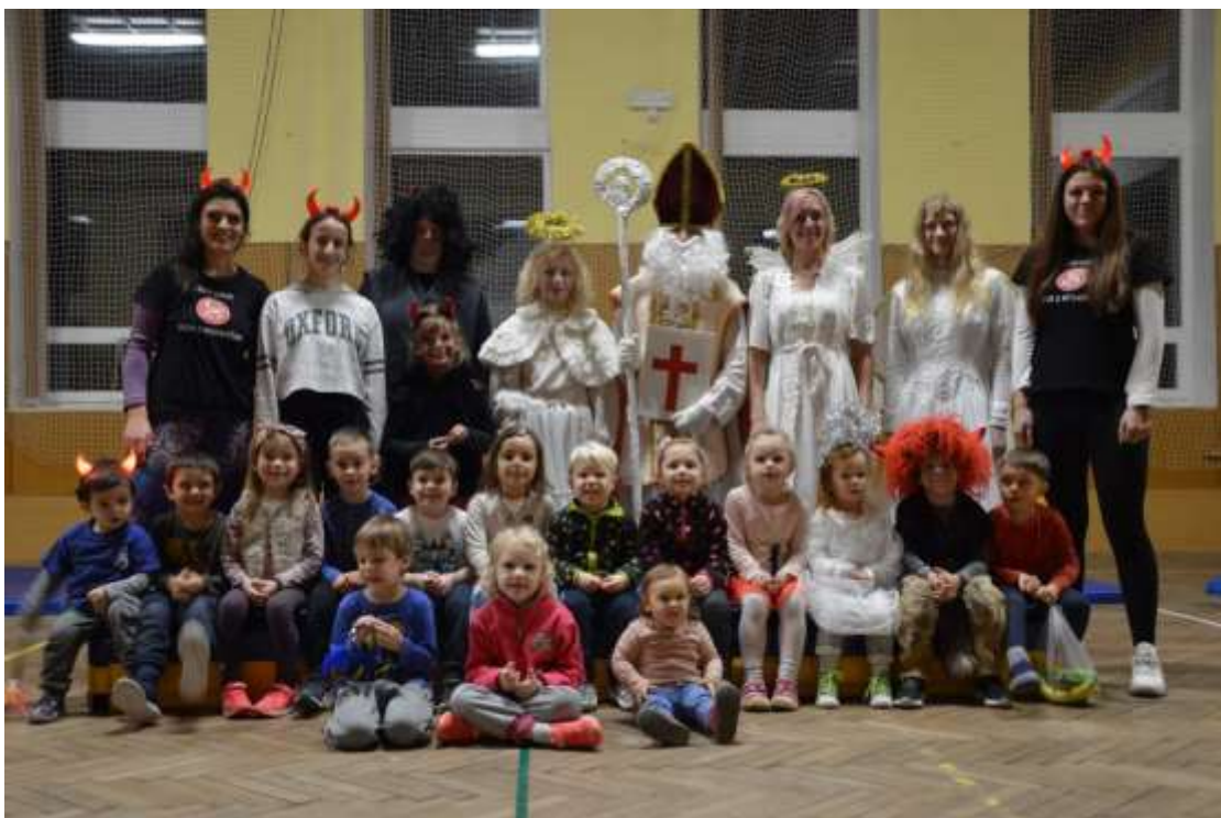
Do sokolovny přišel za dětmi Mikuláš