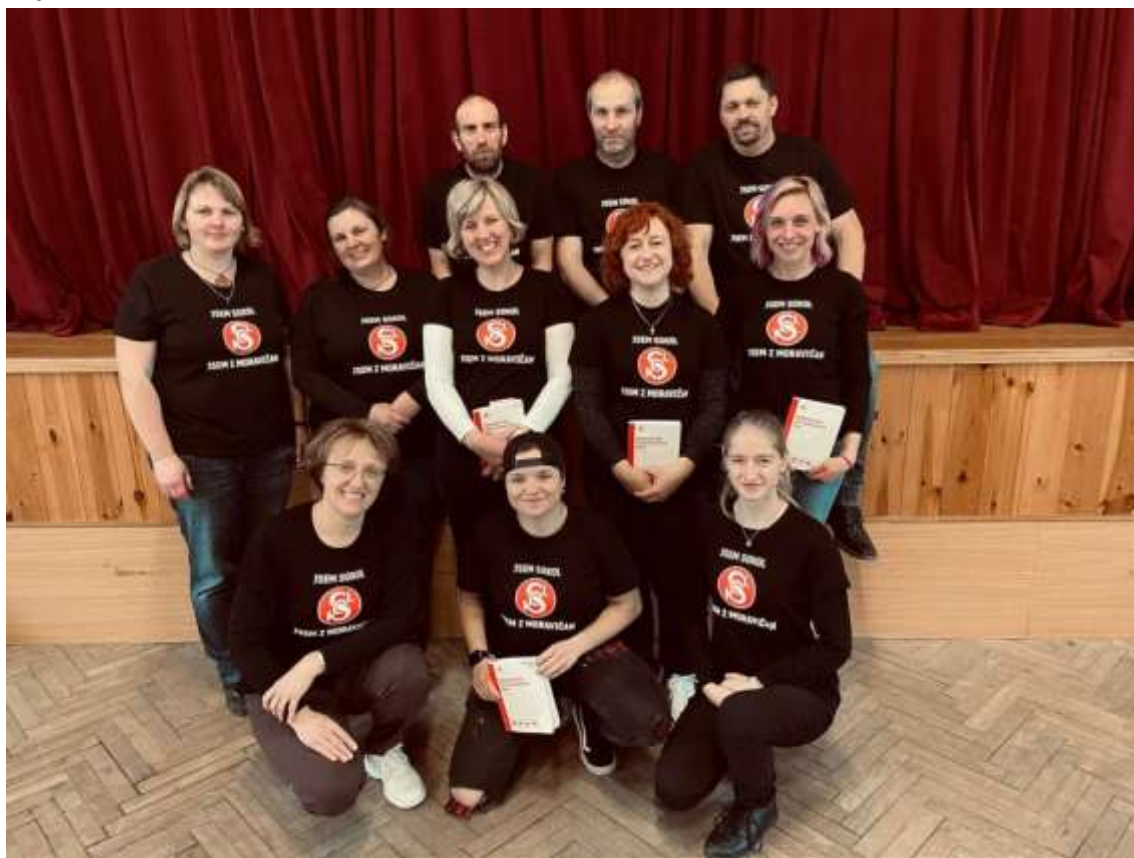
Sokolský výbor a cvičitelé

V sobotu 4. února 2023 se bude konat Sokolský ples, na který jste všichni srdečně zváni.