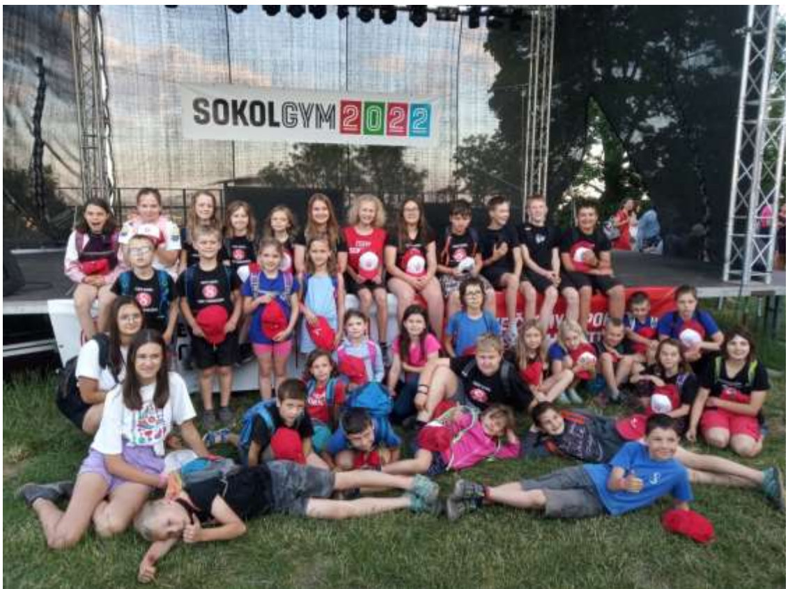
Sokolská výprava do Brna