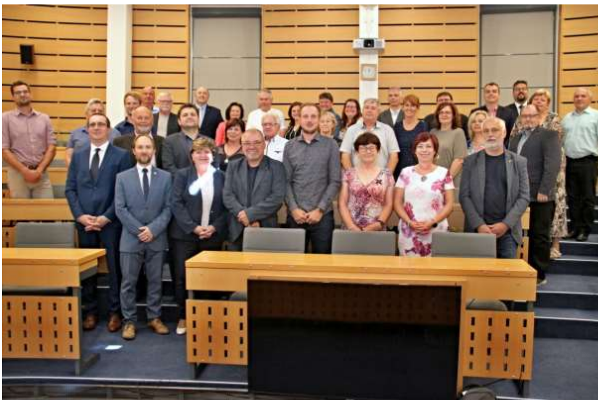
Zástupci zúčastněných obcí na krajském vyhodnocení