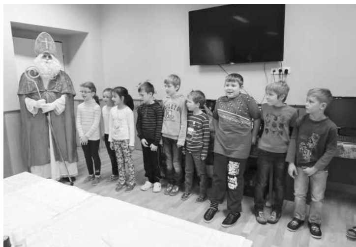
Mikuláš v ZŠ